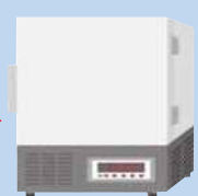
ワクチン保管 フリーザー